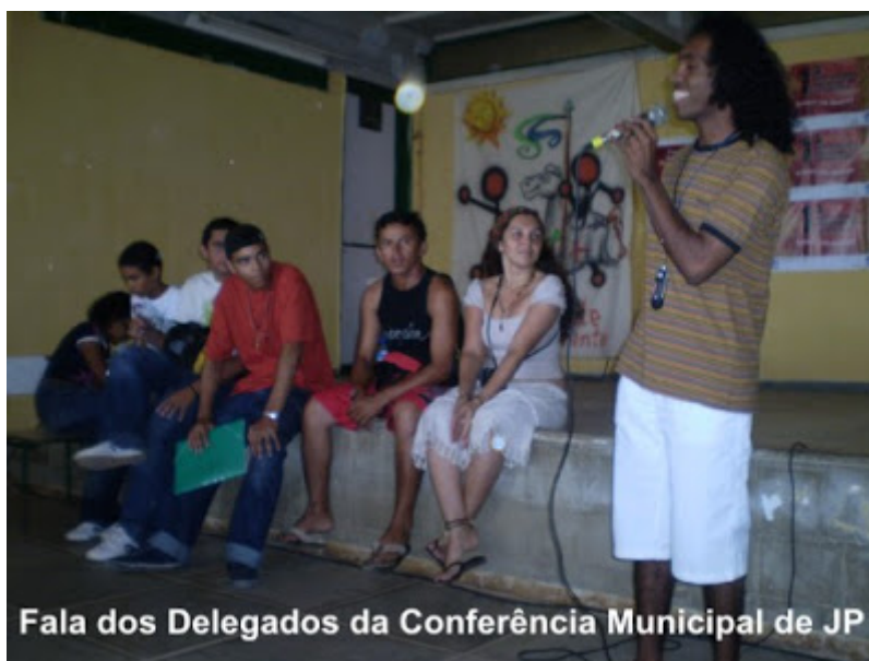
Fala dos Delegados da Conferência Municipal de JP