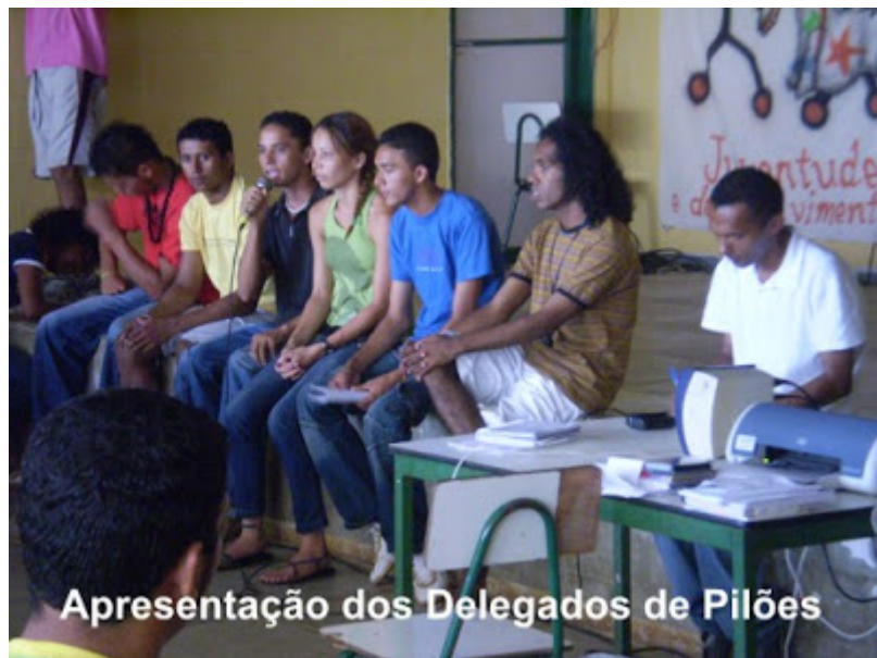
Apresentação dos Delegados de Pilões