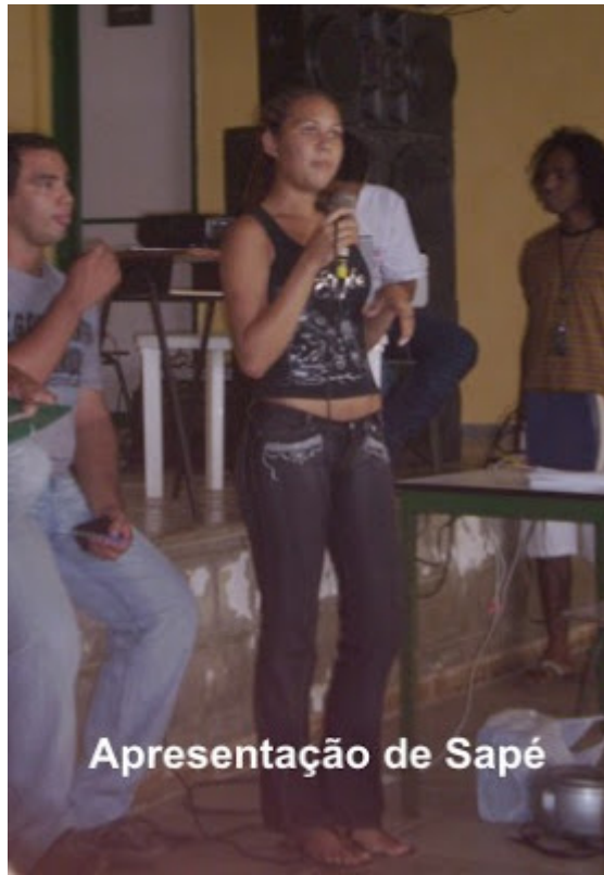
Apresentação de Sapé