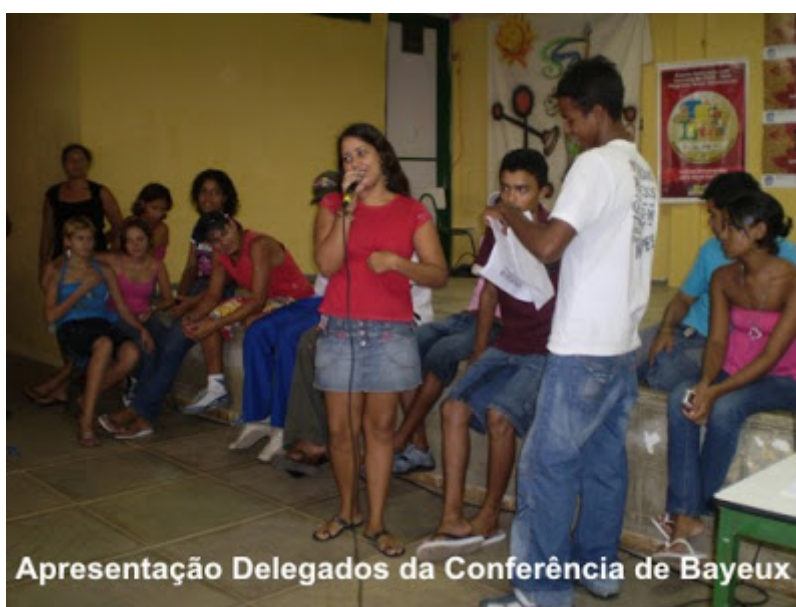
Apresentação Delegados da Conferência de Bayeux