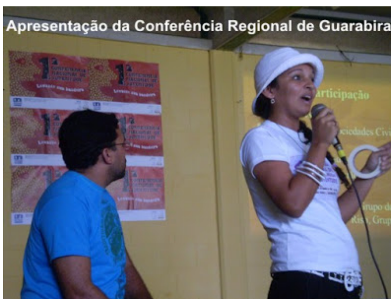
Apresentação da Conferência Regional de Guarabira

Postado por ATORES às 06:02 Nenhum comentário: